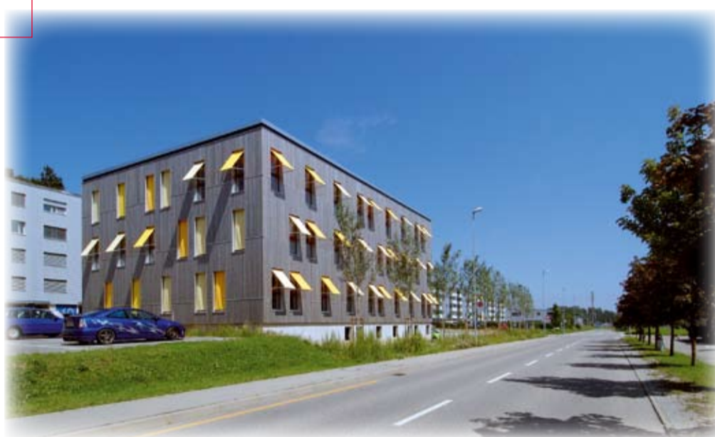
Green Office: exemple de construction durable

Chaque matériau composant ce bâtiment de trois étages a été analysé du point de vue de son impact environnemental. Le bois utilisé provenait des forêts de Fribourg, les crépis intérieurs sont en argile crue et les isolations sont des couches isofloc.