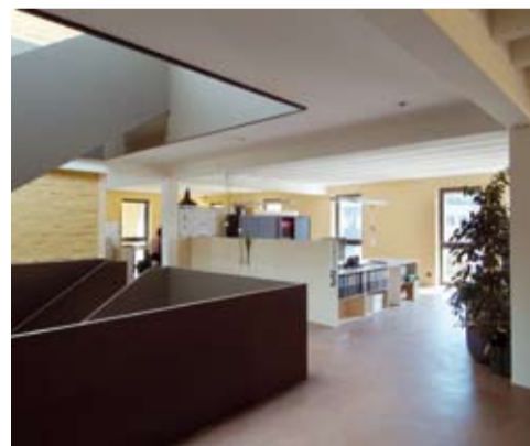
Libre circulation d'air et chaleur entre les bureaux

Le «Green Office» est destiné à l'utilisation par des entreprises sensibles aux questions environnementales. Le bâtiment est conçu selon le principe «faire plus avec moins». Ainsi, 100% de l'électricité consommée est d'origine éolienne. Les toilettes sèches sont entièrement biodégradables, et une citerne de récupération de l'eau de pluie a été installée pour alimenter les lave-mains ou arroser le jardin, ce qui permet de minimiser la consommation d'eau. Chaque entreprise occupant le bâtiment est encouragée à optimiser sa consommation électrique: des écrans plats trônent sur les bureaux, des ampoules à économie d'énergie assurent l'éclairage et la machine à café est reliée à une minuterie.