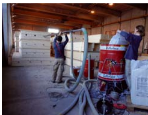
Insufflation des éléments de toiture préfabriqués

Chaque matériau composant ce bâtiment de trois étages a été analysé du point de vue de son impact environnemental. Le bois utilisé provenait des forêts de Fribourg, les crépis intérieurs sont en argile crue et les isolations sont des couches isofloc.