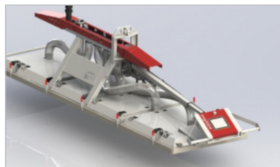
Suspension avec bras pivotant